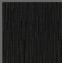
285 - Storm