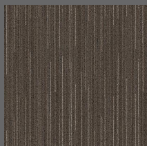
280 - Legacy