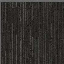
283 - Voyage