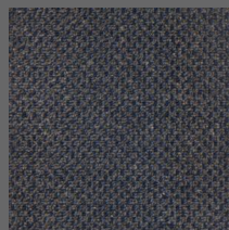
493 - Abrolhos