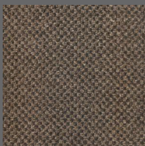
491 - Itajaí