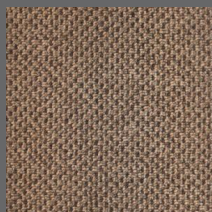
490 - Roraima