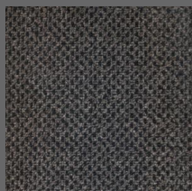
488 - Guartelá