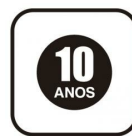
Selo de garantia de uso - Homogêneos